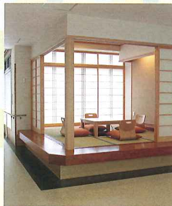
和室：多くのゲストの若き時代を思い出させる、なつかしの掘りごたつのある部屋。