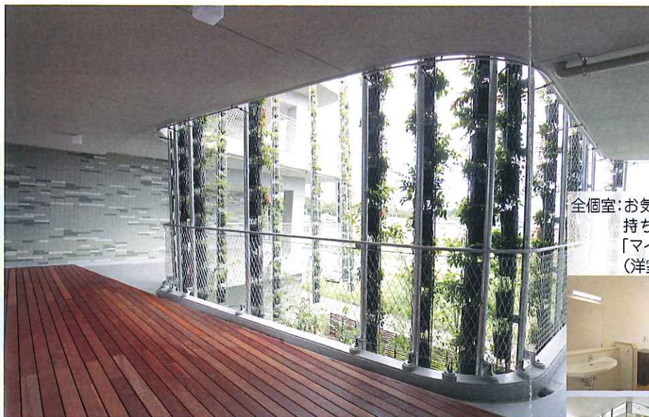
壁面植物と：一年中楽しめる様々な草木を選びウッドデッキ シンチョウゲなどの花の香りや、木の実をついばみに来る小鳥をバリアフリーのウッドデッキから眺められます。ゲストが身近に自然に触れ合える憩いの場。