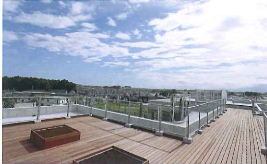
屋上：バリアフリーで、ゲストが楽しめる花壇用の固定プランターがあり、雄大なパノラマは絶景!!