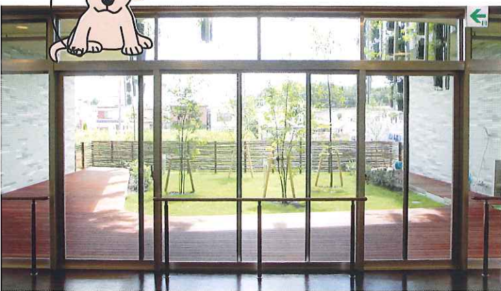
セラピー犬とのふれ合いの場です。

アニマルセラピーは、血圧を安定させたり 薬物治療では出来ない効果事例も多数あります。 当苑では機能訓練として犬とキャッチボールをして います。