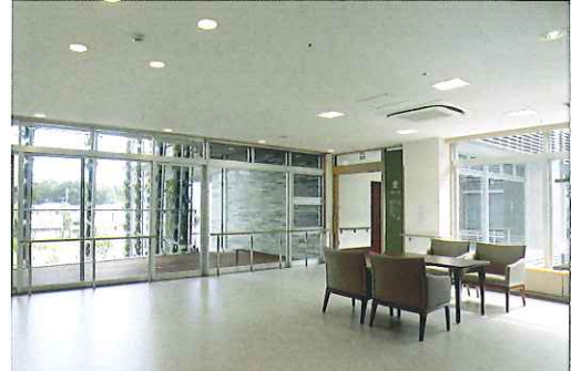
談話スペース：中庭に沿ってたたみ表を使った腰かけが置かれ、緑を眺めながらくつろげます。ゲスト・ご家族の語らいの場。