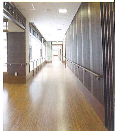
ゆったりとした廊下：「心」と「愛」をつなぐ広い架け橋。