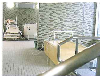
浴室：カーテンでプライバシーが守られた安全でゆったりしたやすらぎの空間。