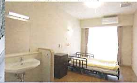
全個室：お気に入りの家具の持ち込みでゲストは「マイホーム」の感覚に。(洋室・和室)